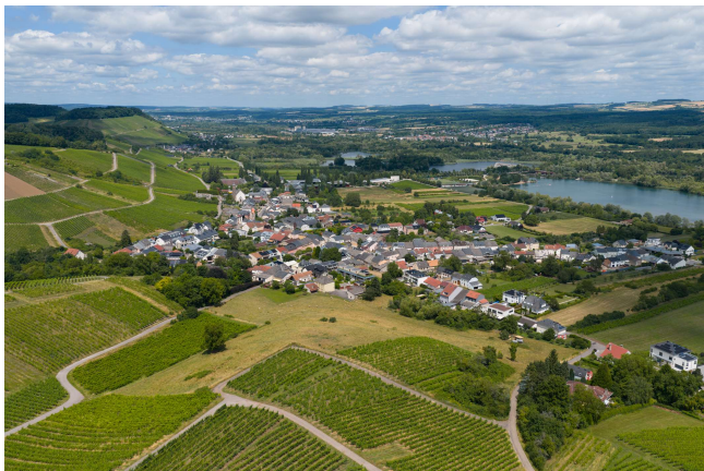
Luxemburgische Weinstraße bei Schengen

In Schengen, wo die nach der Stadt benannten Grenzöffnungs-Verträge abgeschlossen wurden gibt es ein Museum, welches wir besuchen werden.