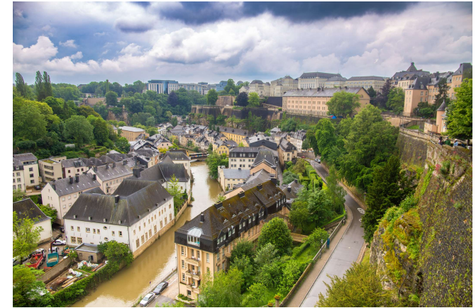
Blick auf das historische Viertel Grund und die Alzette

Nach dem Frühstück machen wir uns auf den Weg in die Hauptstadt des Großherzogtums Luxemburg. Dort sind wir zu einem Besuch in den europäischen Institutionen angemeldet. Die Mittagspause verbringen wir im Zentrum. Nachmittags sehen wir bei einer geführten Stadtführung die malerische Altstadt und sehen uns die Kathedrale Notre Dame von innen an.